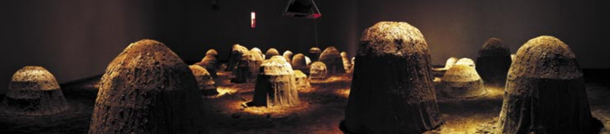
ZEMĚ MATEK, TERRA DELLE MADRI, QUARTER, FLORENCIE, 2005.

Používá nejen tradiční sochařské materiály (dřevo, keramika, bronz, alabastr), ale i nekonvenční hmoty, například rtuť nebo