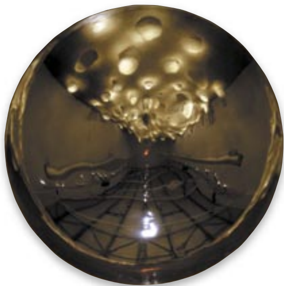
JANUA COELI, LEŠTĚNÁ OCEL, PRŮMĚR 150 cm, 1991, V INSTALACI TERRA DELLE MADRI, QUARTER, FLORENCIE, 2005.

Používá nejen tradiční sochařské materiály (dřevo, keramika, bronz, alabastr), ale i nekonvenční hmoty, například rtuť nebo