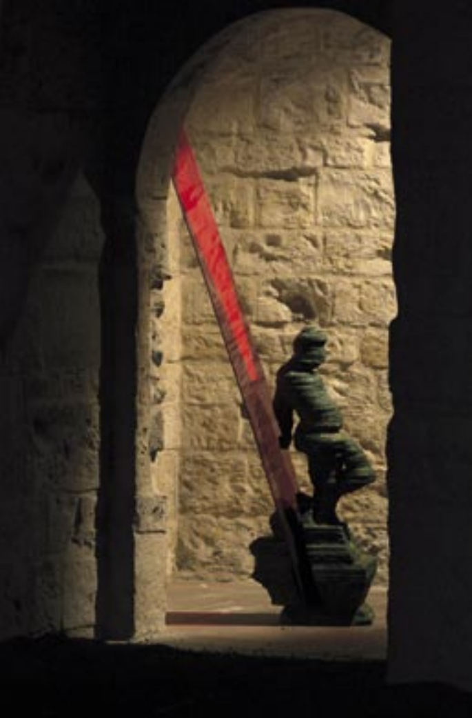
SOCHA, MYSTIKA TVARU, ČMVU PRAHA 2009.

(z roku 1399), který je uložen v Evkaf Museum v Istanbulu. Obrazy odrážející se v zrcadle a jím promítané na stěnu zobrazují transformovaný vzhled perské zahrady. Výstava ozřejmuje dvojí způsob vnímání: vidění a vizi. Rozšíření těchto schopností nám otevírá možnost chápat lépe