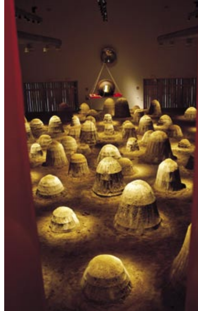
ZEMĚ MATEK, TERRA DELLE MADRI, QUARTER, FLORENCIE, 2005.

Marco Bagnoli ve své snaze poznat Prahu náhodně odhalil zlomek jejího starobylého vzhledu, zrcadlícího se, zdeformovaného a rozděleného na geometrické tvary v oknech skleněné fasády jedné moderní budovy,