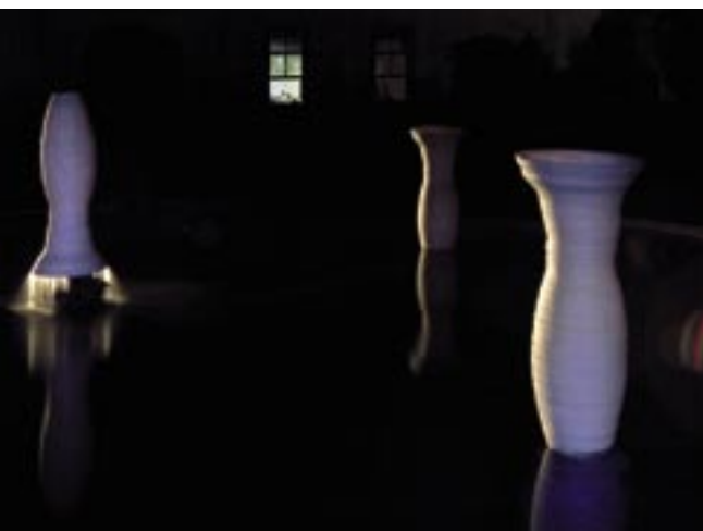
PAESAGGIO, VILLA LA MAGIA, QUARRATA 2007.

Tato teze je kontraproduktivní, protože vytváří zmatek v hodnotách a obecnou dezorientaci. Odstraněním historické a kulturní zkušenosti ze systému hodnocení uměleckých děl se upírá lidstvu možnost růstu tím, že se učí z předchozích zkušeností. Myslím, že tu nebyla dosud větší výzva pro historika umění než najít a odhalit